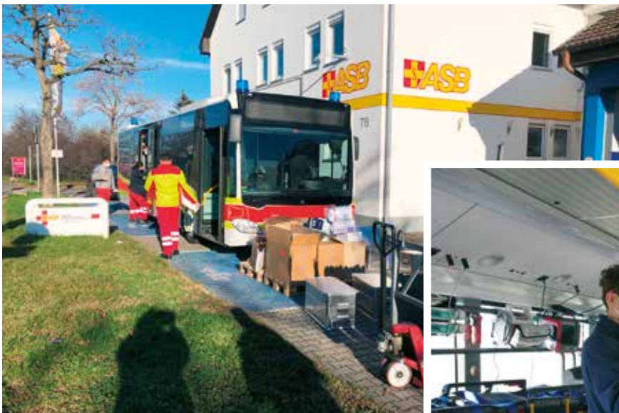
Oben: Der „Großraum-Intensivtransportwagen“ ist ein umgerüsteter Linienbus, mit dem Corona-Patienten in andere Kliniken verlegt werden sollen.