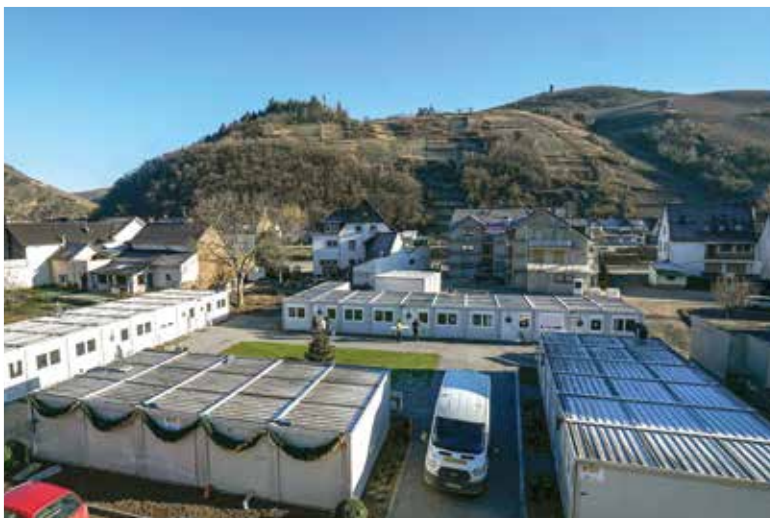
Oben: Die neu errichtete Gemeinschaftswohnanlage in Dernau hat elf Wohneinheiten sowie einen Begegnungsraum.